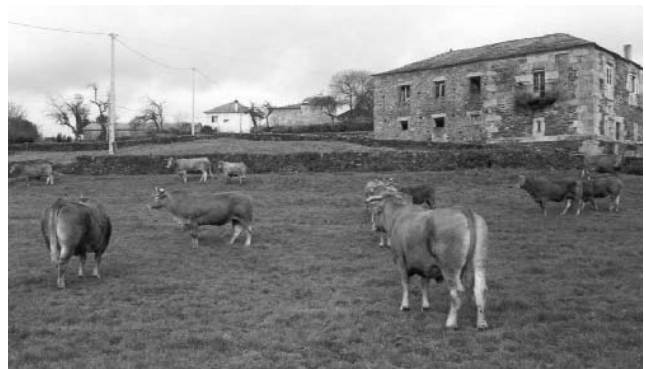
Foto 1.- Detalle de una explotación tradicional de raza Rubia Gallega